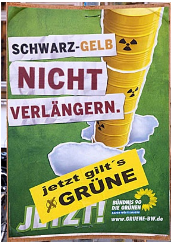
緑の党の選挙ポスター。緑の党の選挙ポスターには、よく反原発のモチーフが登場する

この2週間、CDUのメルケル首相もただ手をこまねいていたわけではない。14日には原発の稼働年数を2030年代半ばまで延長する計画を、昨秋決定したばかりにもかかわらず3カ月凍結すると発表した。さらに15日には国内の原発17基のうち1980年までに稼働を始めた7基の運転を3カ月間停止することも決定している。